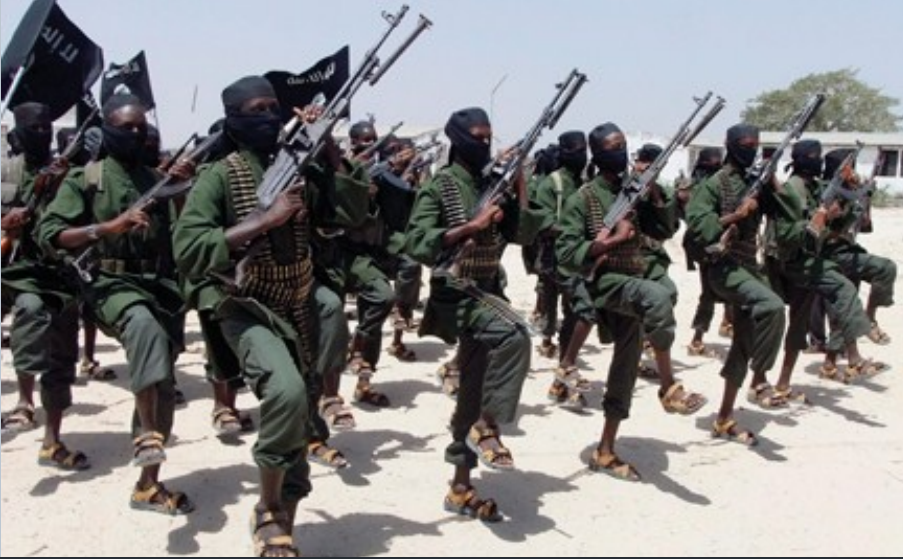
GENÇ MÜCAHİDLER HAREKETİ ÜYELERİNİN EĞİTİMİNDEN BİR KESİT...

Somali topraklarının üçte ikisine hakim olan Genç Mücahidler Hareketi (Şebab), Amerika ve İsrail'in istihbarat ve komuta desteğiyle Kenya ve Etiyopya orduları tarafından etkisiz hale getirilmek isteniyor. Dünya medyası Şebab Hareketi'ne ve Somali halkına yönelik vahşi saldırıları görmezlikten gelirken dergimiz, Somali'de meydana gelen son olayları Somali mediasından ve mücahid kaynaklardan bildiriyor.